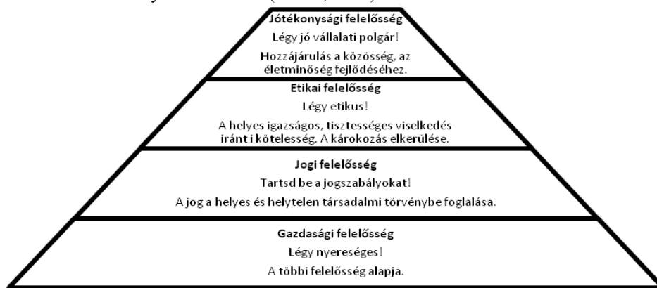
1. ábra: A vállalati társadalmi felelősség piramisa

A CSR legismertebb modellje szerint a vállalatok társadalmi felelőssége gazdasági, jogi, etikai és jótékonyági elvárásokat jelent, mely a társadalom részéről jelentkezik (Carroll, 1979 p. 500). A felelősségi területek alapja a gazdasági felelősség, de ezzel egyidőben a vállalatoknak be kell tartani a jogszabályokat is. Az etikai felelősség a helyes, igazságos és tisztességes viselkedés iránti elkötelezettséget jelenti. A negyedik terület, amikor a vállalatok jó közösségi polgárként viselkednek (1. ábra). Az egyes felelősségi szintek együtt alkotják a vállalati társadalmi felelősség egészét. Megfelelés van a CSR modell és az érintett felfogás között, ez alapján a társadalmi felelősség az érintettek (tulajdonosok, munkavállalók, vevők, helyi közösség) iránti felelősségvállalást jelent (Carroll, 1991). A vállalatoknak egyensúlyt kell teremteni a gazdasági felelősség (saját magával törődés) és a jogi, etikai valamint jótékonyági felelősség (másokkal való törődés) között. A CSR mozgalom „lelke” a tisztességes, korrupciómentes vállalati magatartás, amely tiszteletben tartja az emberi jogokat, a munkajogi elvárásokat és a természeti környezet védelmét (Carroll, 2015).